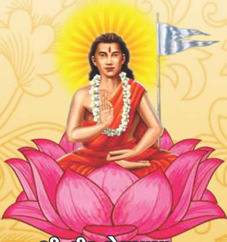
શ્રી વીર મેઘમાયા

સંપર્ક કાર્યાલય : વીર મેઘ મહાર ભવન, બહુચર નગર સોસાયટી, વેડરોડ, સુરત