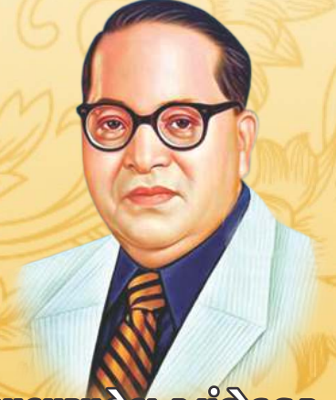
ડૉ. બાબાસાહેબ આંબેડકર